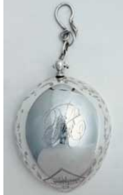
Totuma para tomar agua que perteneció al general Rafael Uribe Uribe (hacienda El Palmar, Valparaíso [Antioquia]; 12 de abril de 1859- Bogotá, 15 de octubre de 1914) c 1900 Plata 9,5 x 6,8 x 4 cm Propiedad particular, Bogotá

Las ilusiones de los llamados pacifistas , entre quienes se contaba la mayoría de la dirección del partido liberal, entre ellos Aquileo Parra, Salvador Camacho Roldán y Sergio Camargo, hallaron un magnífico aliado en la distancia creciente entre los integrantes del gobierno de Caro, o nacionalistas , y el grupo conservador de los llamados históricos . En tanto los belicistas liberales, entre quienes se contaban Rafael Uribe Uribe, Cenón Figueredo, Foción Soto, Justo L. Durán y Paulo E. Villar, encontraron importante respaldo a sus argumentos en muchas de las acciones del gobierno que, después de haberles abierto una rendija, terminó tirándoles la puerta en las narices.